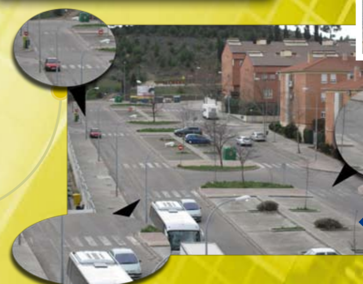
Ahora el Gobierno ha renovado la señalética a 2 meses de las elecciones, pero como siempre se ha olvidado del Pinar.