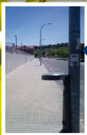
Sin papeleras ni limpieza.