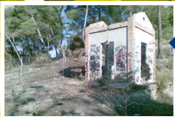
El Pinar no puede tener este aspecto.