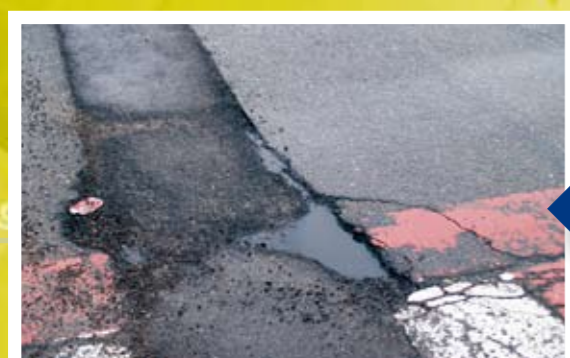
Y el Paseo del Deleite con obras mal rematadas...