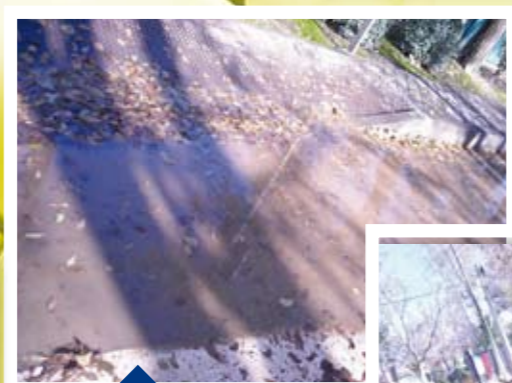
La lluvia os deja charcos durante días.