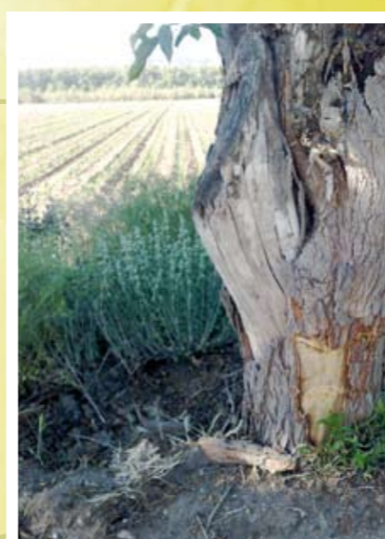
Cuando han realizado obras no han respetado el medio ambiente.