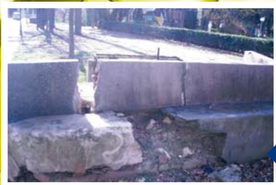
Hay zonas peligrosas cerca de zonas de juegos para niños.