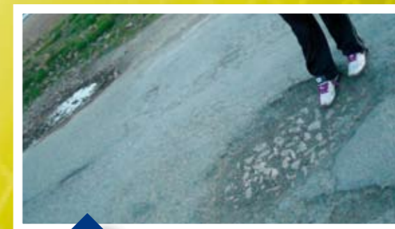
Los accesos al Real Cortijo están completamente abandonados.